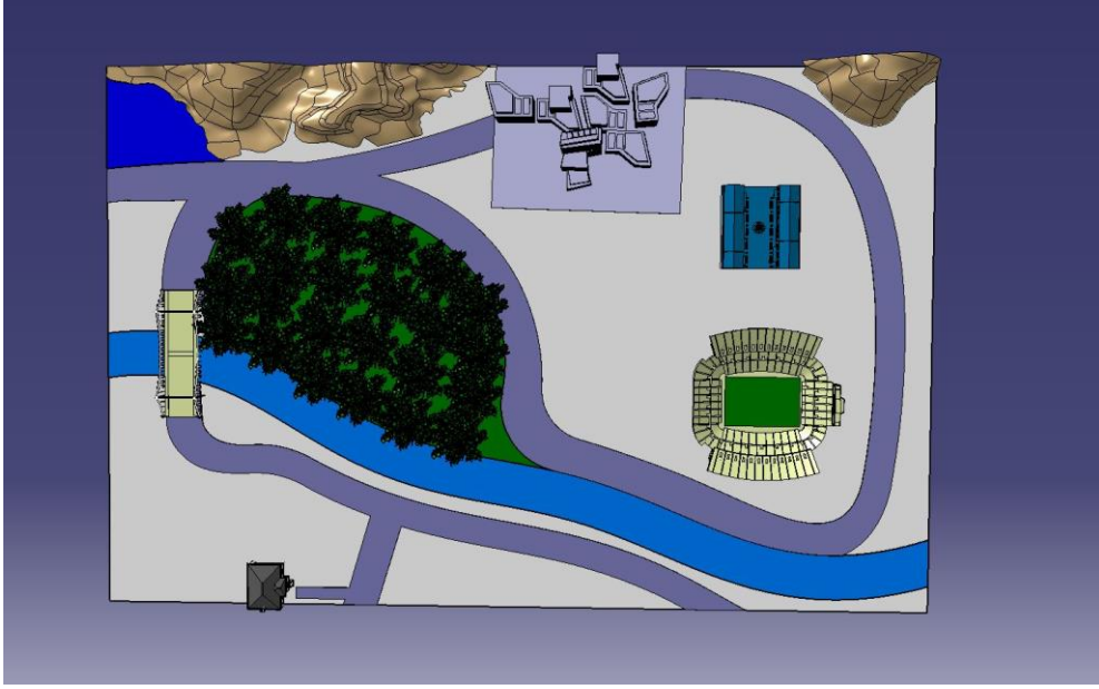
Şekil 1. Senaryo Ortamı

Ulaşım senaryosu ortamına ait video aşağıdaki dosyada yer almaktadır.